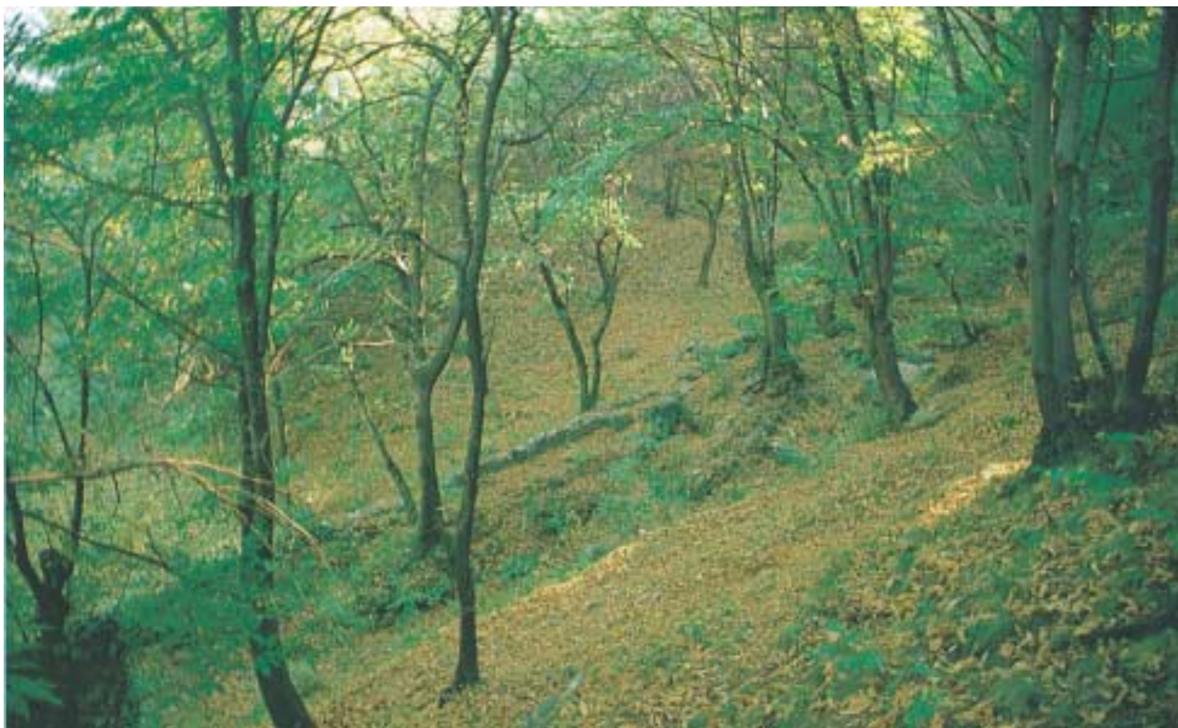
Castagneto in autunno in Valchiavenna.

proprietà mineralizzanti e corroboranti delle castagne – proibite ai diabetici e agli obesi – e le virtù astringenti, toniche e curative contro le affezioni bronchiali, di tisane e decotti ottenuti con le varie parti della Castanea . Fra le altre cose, la notevole percentuale di tannino suggerisce di utilizzare foglie e corteccia per preparare tinture e prodotti per l'igiene dei capelli.